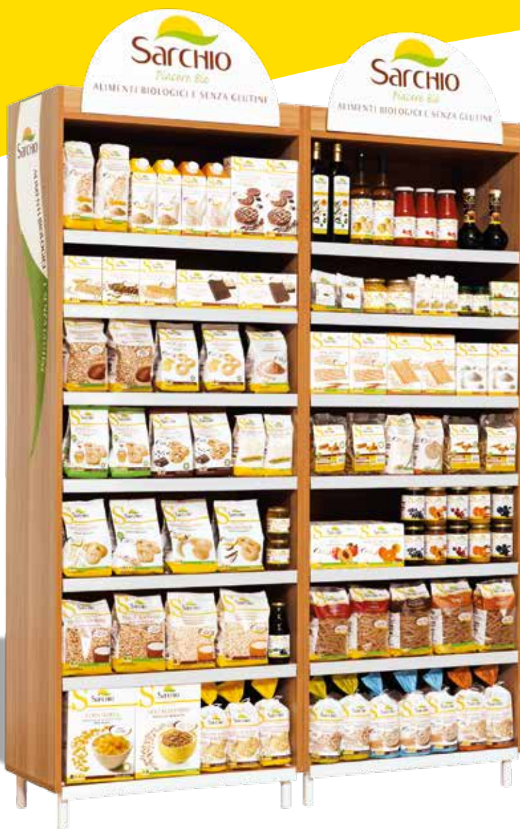
EXPOSITOR DE MADERA DIM. CM 72,5X217, PROFUNDIDAD CM 38