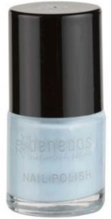
ICE ICE BABY