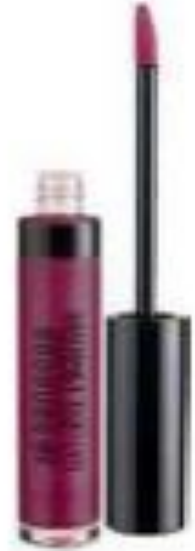
BRILLO ROSE GARDEN