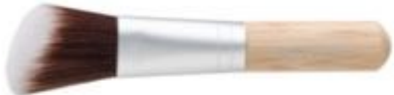
BROCHA PARA COLORETE