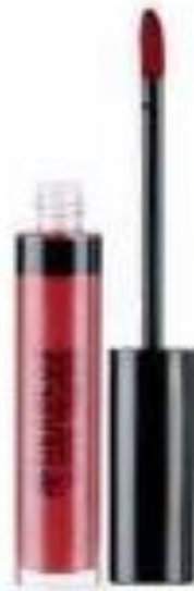
BRILLO KISS ME