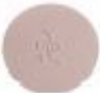
ILUMINADOR POLVO COMPACTO POLVO