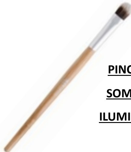
PINCEL DE SOMBRA E ILUMINADOR