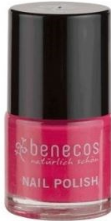
OH LA LA!