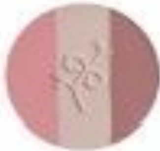
FALL IN LOVE (ENAMORATE)